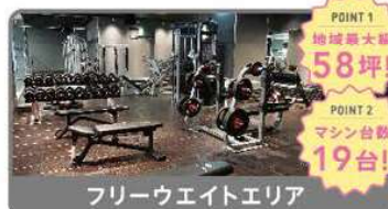
フリーウエイトエリア

※家族会員は、1名の会員につき2歳等以内のご家族3名まで無料でご利用いただけます。同時利用はできません。※ご入会時に会員カード発行料が5,000円(税込5,500円)がかかります。※セキュリティ管理/施設メンテナンス料年額4,980円(税込5,478円)がご利用開始月を初月として3ヶ月目にかかります。