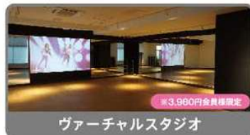
ヴァーチャルスタジオ