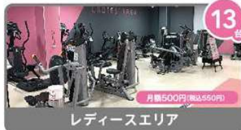
レディースエリア